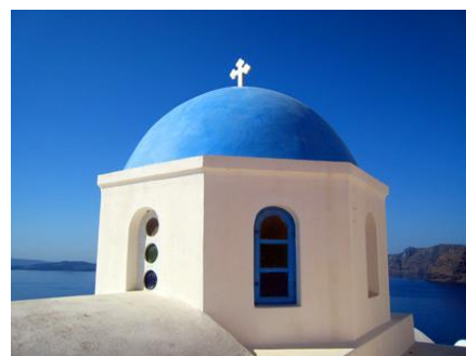
Una iglesia griega

En el siglo 21, la palabra en griego moderno para “cruz” es “σταυρός” – (“staurós”) ¡igual que en el primer siglo! Esto no quiere decir “un palo”; quiere decir “una CRUZ”. La palabra “crucificando” es “εσταυρομένος” (“estauromenos”), la cual tiene como raíz σταυρο (“stauro”) de σταυρος (“stauros”). Si no supiéramos el significado que dan los griegos a esta palabra, no tendríamos que hacer nada más que mirar cualquier iglesia griega, y veríamos en lo alto del edificio por fuera una cruz , ¡no un palo!